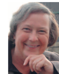
Bärbel Höhn MdB Bündnis 90/ Die Grünen